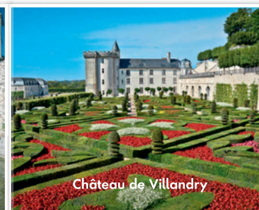
Château de Villandry