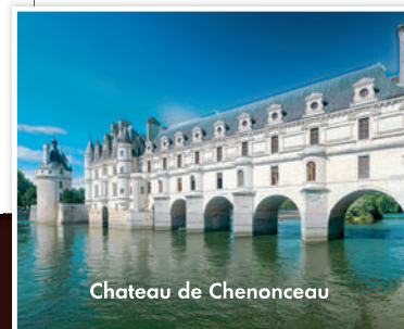
Chateau de Chenonceau

Inscription les mercredi 8 et jeudi 9 juin 2022 uniquement.